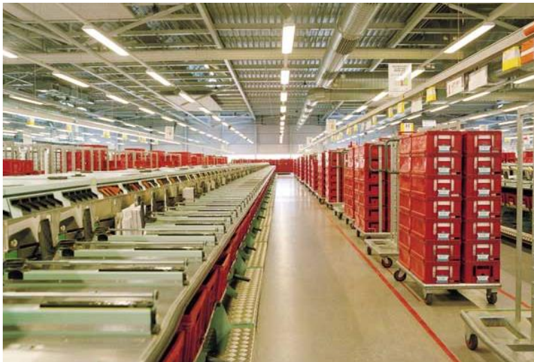
Moderne sorteer en afstempelmachiene

Opmerking. Bij het vaststellen van dit artikel in januari 2011 was de officiële naam Koninklijke TNT Post.